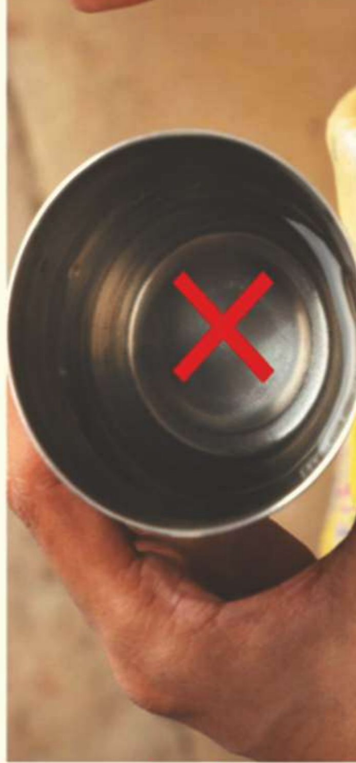
మంచి నీళ్లు తాగించకూడదు