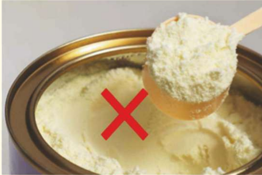
పాడర్ పాలు ఇవ్వకూడదు