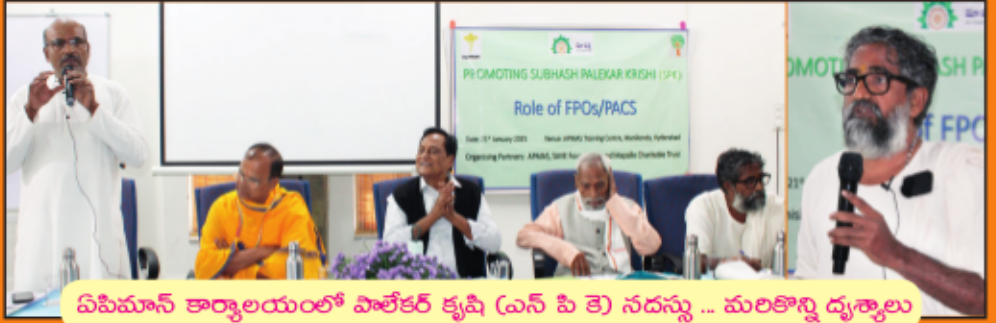
ఏపిమాన్ కార్యాలయంలో పాలేకర్ కృషి (ఎన్ పి కె) నదస్సు ... మలికొన్ని దృశ్యాలు