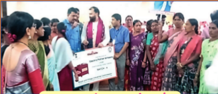
కుండల తయారీ శిక్షణ ... సర్టిఫికేట్ల పంపిణీ