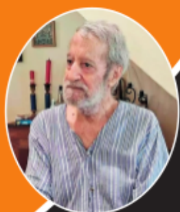
బతుకుచిరుపు చూపిన బేడీ కన్నమూత