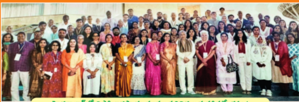
హైదరాబాద్ లో విప్రో భాగస్వామ్య సంస్థల ప్రతినిధుల మహా సమ్మేళనం !