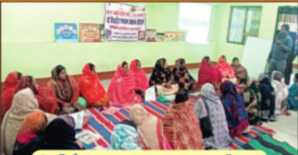
జీవోలో పుట్టగొడుగుల పెంపకంపై ఏపిమాన్ శిక్షణ