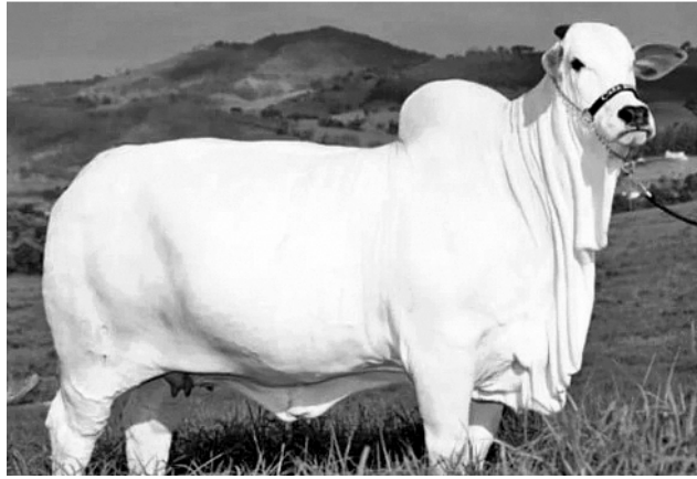
బ్రెజిల్ వేలంలో రూ.41 కోట్లుపలికిన ఒంగోలు జాతి ఆవు

ఒంగోలు జాతి ఆవులు, ఎద్దులు అందరి దృష్టిని విశేషంగా ఆకర్షించాయి. చూడటానికి ఒంగోలు గిత్తలు ఎంత అందంగా ఉంటాయో, అవి బరిలో దిగి కలబడే తీరూ అంతే అందంగా ఉంటుంది. ఇక... ఒంగోలు జాతి ఆవుల పరంగా చూస్తే రోజుకు 20 లీటర్ల పాలు