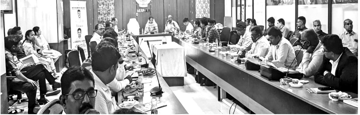
ఆంధ్రప్రదేశ్ మైక్రోఫైనాన్స్ సమావేశం దృశ్యం

బ్యాంకుల (ఎస్ ఎఫ్ బి లు) సమావేశం 2025 ఫిబ్రవరి 21 న విజయవాడలో జరిగింది.