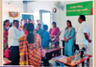
గోరంట్లపల్లిలో నైపుణ్య శిక్షణ కేంద్రం ప్రారంభోత్సవం ... మరికొన్ని దృశ్యాలు