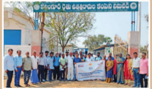
కళింగూర్ రైతు ఉత్పత్తిదారుల కంపెనీ విడుదలి