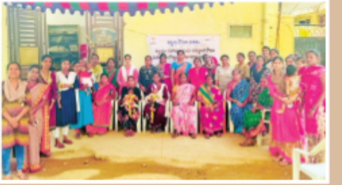
ఏ ఎస్ రావు నగర్ లో ఎస్ హెచ్ జి మహిళలకు ఆరోగ్య భద్రతపై అవగాహన