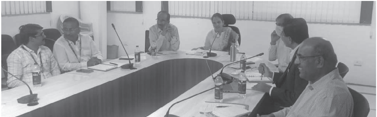
నిగూడ అవకాశాలను చూసే దార్శనికత, అసాధ్యాలను సాధించే తపన వుంటే గెలుపు మీదే