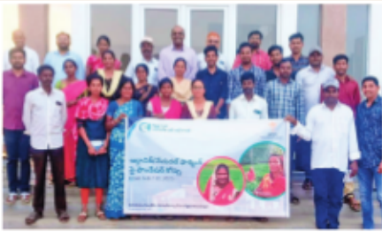
సి ఎస్ ఏ ఆధ్వర్యంలో ఏపిమాన్ , అశోక విశ్వవిద్యాలయం ప్రతినిధులకు శిక్షణ