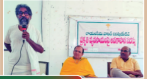
మదనపల్లిలో ఏపిమాన్ ఆధ్వర్యంలో ప్రకృతి వ్యవసాయంపై సదస్సు దృశ్యాలు