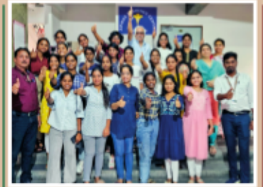
ఎన్ టీ ఆర్ మహిళా కళాశాలల విద్యార్థినులకు ఇంటర్షిప్