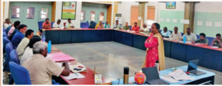
తమిళనాడుకు చెందిన ఇసాఫ్ ఫౌండేషన్ ప్రతినిధులకు ఏపిమాన్ శిక్షణ ... అవగాహన వర్కుటన