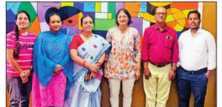
కెంట్ యూనివర్సిటీ, వాటర్ ఆర్గ్ ప్రతినిధులు ఏపిమాస్ కార్యాలయ సందర్శన దృశ్యం

బట్వాడా కాకపోతే దయచేసి ఈ చిరునామాకు తిప్పింపండి