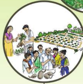
నాణ్యమైన విత్తనాల వాడకం