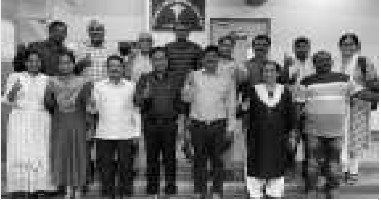
ఆప్టి ప్రాజెక్టు 'పుత్తి' బృందం ఏపిమాస్ ప్రతినిధులతో సమాలోచనల సందర్భం

ఆంధ్రప్రదేశ్ రాష్ట్రంలోని అన్నమయ్య, చిత్తూరు, అనంతపురం జిల్లాలలో పుత్తి సంస్థ సహ భాగస్వామ్యంలో ఏపిమాస్ 13 ఎఫ్ పి ఓలలో 'ఆప్టి' ప్రాజెక్టును అమలు చేస్తున్నది. మహిళలు, చిన్న రైతులు, చిరువ్యాపారులు, చిన్న పారిశ్రామికవేత్తల జీవనోపాధులను మెరుగుపరచి అర్జులైన వారందరికి సబబైన రీతిలో ఆర్థిక అవకాశాలు లభ్యమయ్యేలా చూడాలన్నదే ఈ ప్రాజెక్ట్ ముఖ్య ఉద్దేశం.