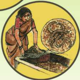
జీవ ఎరువుల వాడకం