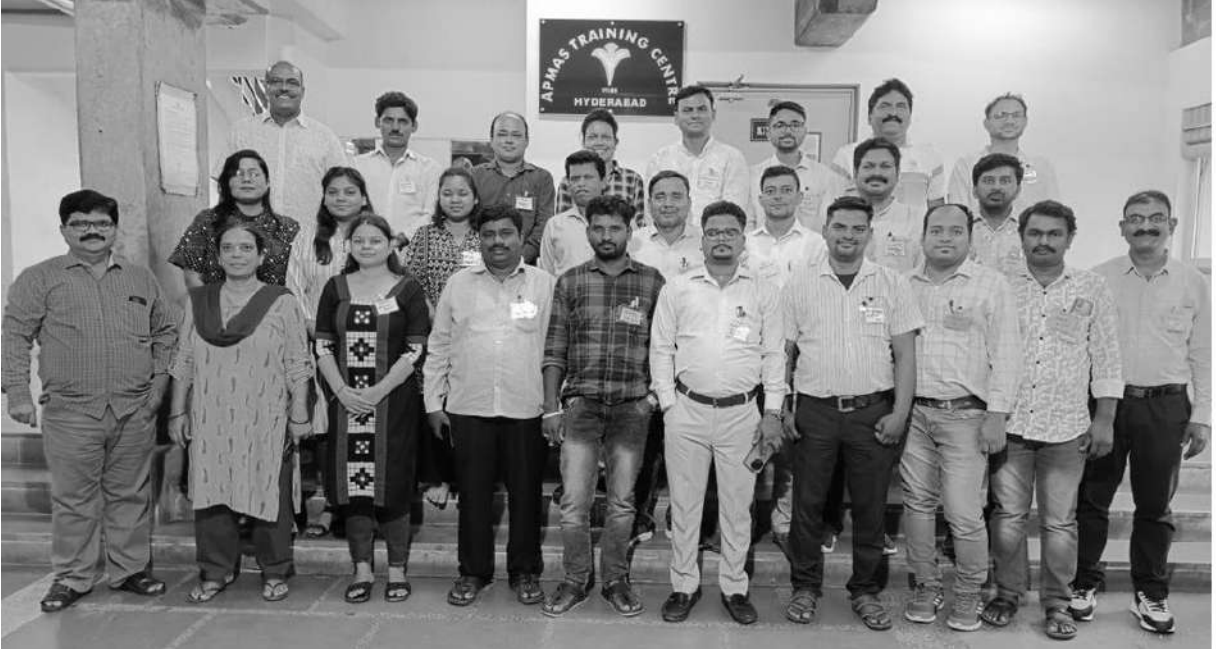
ఓడిపోతానేమోననే భయం నిన్ను విజయ తీరానికీ చేరుస్తుంది

ఈ విధంగా ఐదు రోజుల పాటు జరిగిన శిక్షణ ముగింపు సందర్భంలో అభ్యాసకులు మాట్లాడుతూ, శిక్షణ చాలా బాగా జరిగినదని, శిక్షణయిచ్చిన రిసోర్స్ పర్సనల్ కు, శిక్షణ ఏర్పాటుచేసిన ఏపిమాస్ కు ప్రత్యేక ధన్యవాదాలు తెలిపారు.