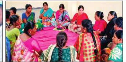
ఏ ఎస్ ఆర్ నగర్ ఎస్ హెచ్ జి , పాలేకర్ ఎఫ్ పి ఓ బోర్డు , నేవాలాల్ ఎస్ ఎల్ ఎఫ్ సమావేశాల దృశ్యాలు