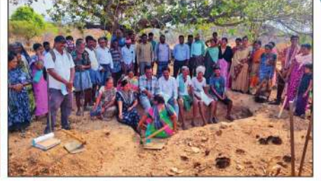
రాయలసీమ జల ప్రేరణ ప్రాజెక్ట్ బృందంతో కలసి శ్రీ సి ఎస్ రెడ్డి అన్నమయ్య జిల్లాలో కార్యక్రమాల సందర్శన