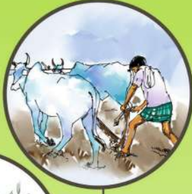
లోతుగా దుక్కులు దున్నడం