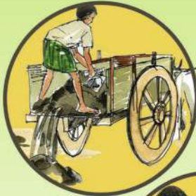
చెరువు మట్టి చల్లడం