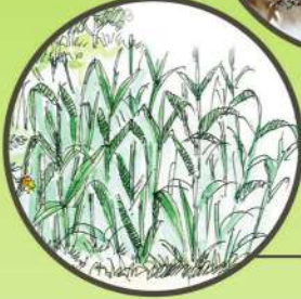
పొలంలో పచ్చి రాట్ట ఎరువు సాగు