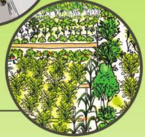
వైవిధ్య పంటల సాగు